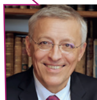
Jacques GUÉRIN , président du CNOV

« Quand le vétérinaire demandera son habilitation sanitaire ou qu'il sera désigné par l'éleveur pour être vétérinaire sanitaire de l'élevage, plutôt que de remplir des CERFA et de les envoyer à l'administration, tout se fera maintenant en quelques clics. (...) C'est vraiment un outil central de gestion d'un cabinet vétérinaire. »