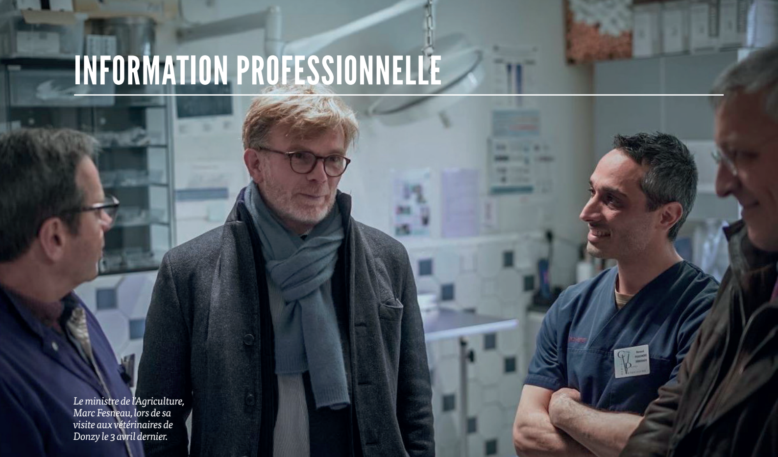
Le ministre de l'Agriculture, Marc Fesneau, lors de sa visite aux vétérinaires de Donzy le 3 avril dernier.